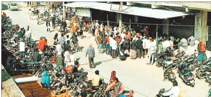
बैंक के सामने किसानों की भीड़।

लखनपुर ब्लॉक के लखनपुर, जमगला, अमलभिठ्टी, कुन्नी, चांदो, पुहुपुरा, लहपट्टा, निम्हा और अमरा समितियों के पंजीकृत किसान रोजाना बैंक के चक्कर काट रहे हैं। दूर-दराज गांवों से आने वाले किसान सुबह से शाम तक बैंक में इंतजार करते रहते हैं, लेकिन पर्याप्त नकदी नहीं होने के कारण कई किसानों को बिना पैसा लिए ही वापस लौटना पड़ रहा है। बैंक