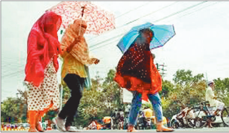
लगना तथा बेहोशी जैसे लक्षण दिखाई दे सकते हैं। सीएमएचओ ने बताया कि बहुत आवश्यक न हो तो लोग दोपहर के समय घर से बाहर न निकलें।